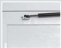
Gasdruckdämpfer zur Endlagensicherung, optional OTS (mit/ohne Rastfeststellung) erhältlich