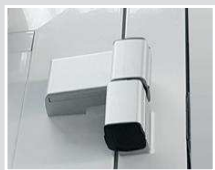
Stabile 3D-Bänder zum einfachen Justieren, mit Aufpreis auch in Torfarbe