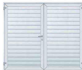
1. Waagerechte Sicke Verkehrsweiß, ähnlich RAL 9016