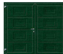
4. Kassettenprägung Tannengrün, ähnlich RAL 6009

Unsere DuoPort-Drehflügeltore sind in vielen Oberflächen und Farben erhältlich. Weitere Informationen finden Sie in unserem Tor-Finder auf Seite 48. Hinweis: Alu-Profile der zweiflügeligen Drehflügeltore werden bei folierten Farbtönen und Satin-Oberflächen in einem entsprechenden Korrespondenzfarbton ausgeführt.