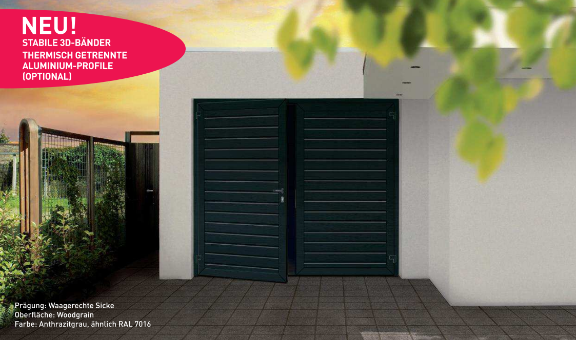
Prägung: Waagerechte Sicke Oberfläche: Woodgrain Farbe: Anthrazitgrau, ähnlich RAL 7016

STABILE 3D-BÄNDER THERMISCH GETRENNTE ALUMINIUM-PROFILE (OPTIONAL)