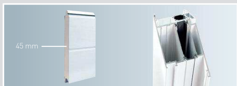
45 mm Dämmung und thermisch getrennte Profile (optional)

Alle Torblattrahmen sind aus Aluminium gefertigt und garantieren höchste Witterungsbeständigkeit. Weitere Besonderheiten des Drehflügeltors finden Sie hier aufgeführt: