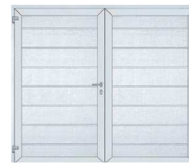
2. Großsicke Verkehrsweiß, ähnlich RAL 9016