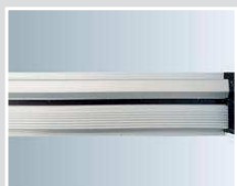
Thermisch getrennte Bodenschiene