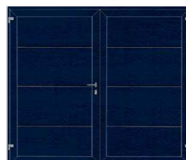
3. Großlamelle Stahlblau, ähnlich RAL 5011