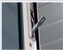
Kantriegel zur Verriegelung des Standflügels (oben und unten)